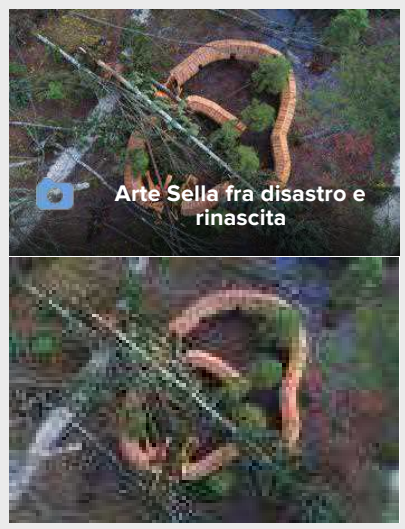
Arte Sella fra disastro e rinascita